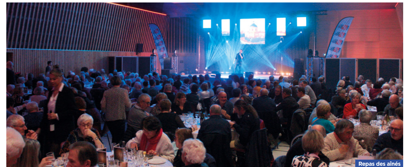
Repas des aînés